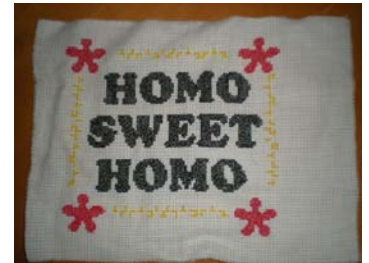
Eksempel på korsstingsbroderi.