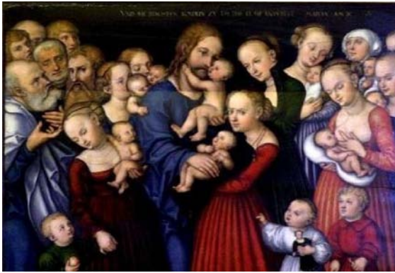
"La de små barna komme til meg" malt av Lucas Cranach.