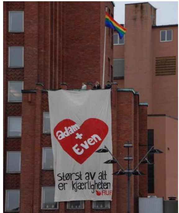
AUF-banner på Folketeaterbygningen.

Svar: Ja, jeg har selvfølgelig mange gode råd. Det viktigste må være å fortsette den offensive holdningen om at det er mulig å forandre verden. Personlige hjertesaker er å sørge for lovfesta rett til lærlingplass, 11 måneders studiefinansiering og 50 % studentrabatt på buss og tog.