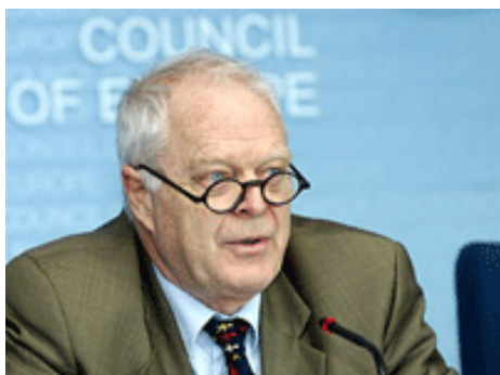
Thomas Hammarberg utfordrer myndighetene i Europa til å ta LHBT-diskriminering på alvor.

"Significant, but uneven progress". Det var ordene Europarådets menneskerettighetskommissjonær Thomas Hammarberg brukte da han offentliggjorde den hittil største europeiske undersøkelsen om diskriminering av lesbiske, homofile, bifile og transpersoner (LHBT). Rapporten etterlater ingen tvil: Menneskerettighetsbruddene mot LHBT-personer i Europa er mange og alvorlige. Forskjellene mellom landene er store, mange steder går det ikke raskt og noen steder går det ikke en gang i riktig retning. Og likevel: Det går framover.