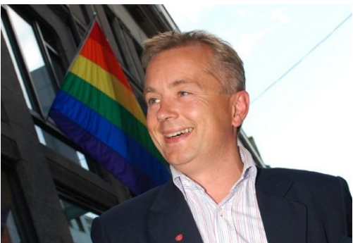
Justisminister Knut Storberget utenfor Homohuset i Kongensgate.